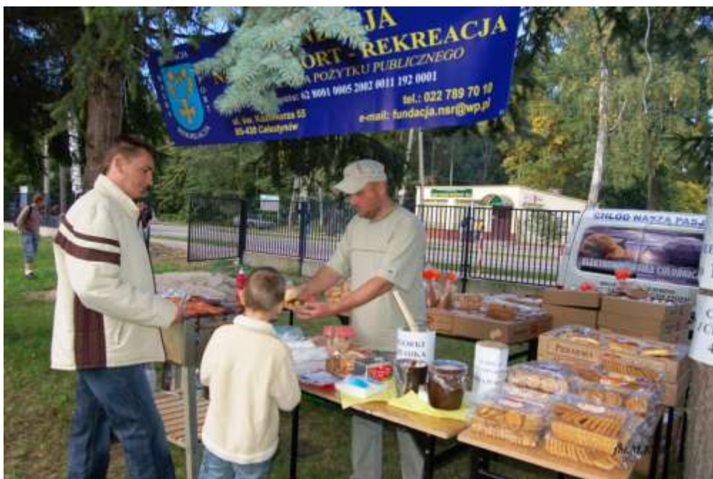
bufet zorganizowany przez Fundację NAUKA-SPORT-REKREACJA