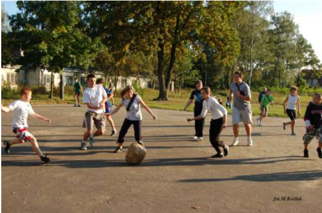
„ekologiczna” piłka nożna