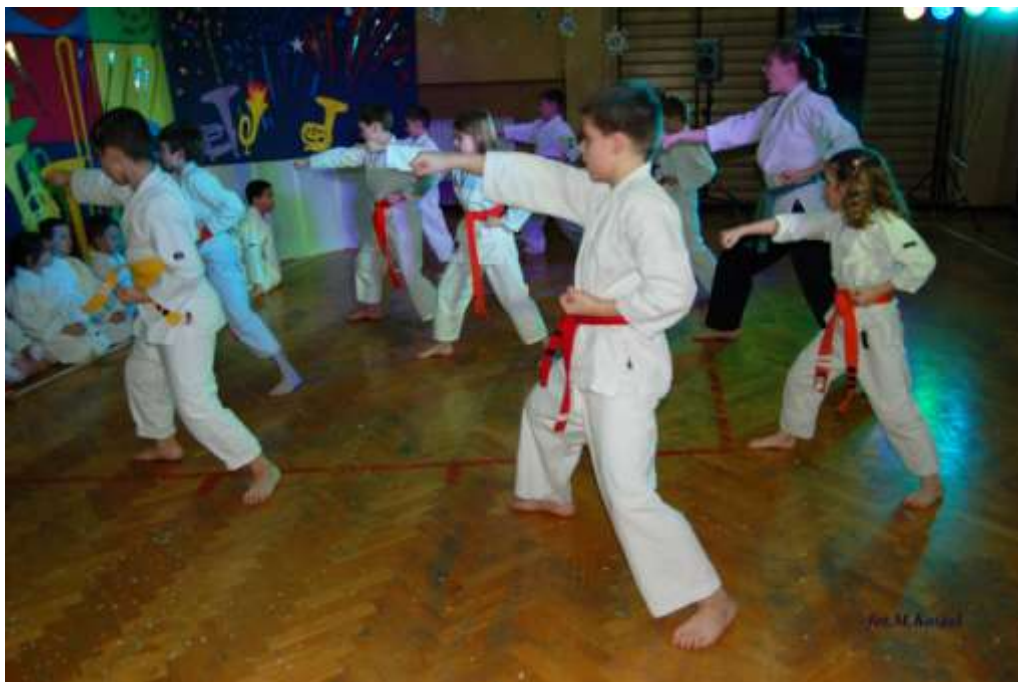
Pokaz uczniów ćwiczących Karate