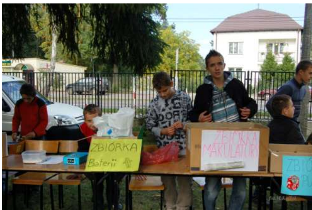
zbiórka surowców wtórnych