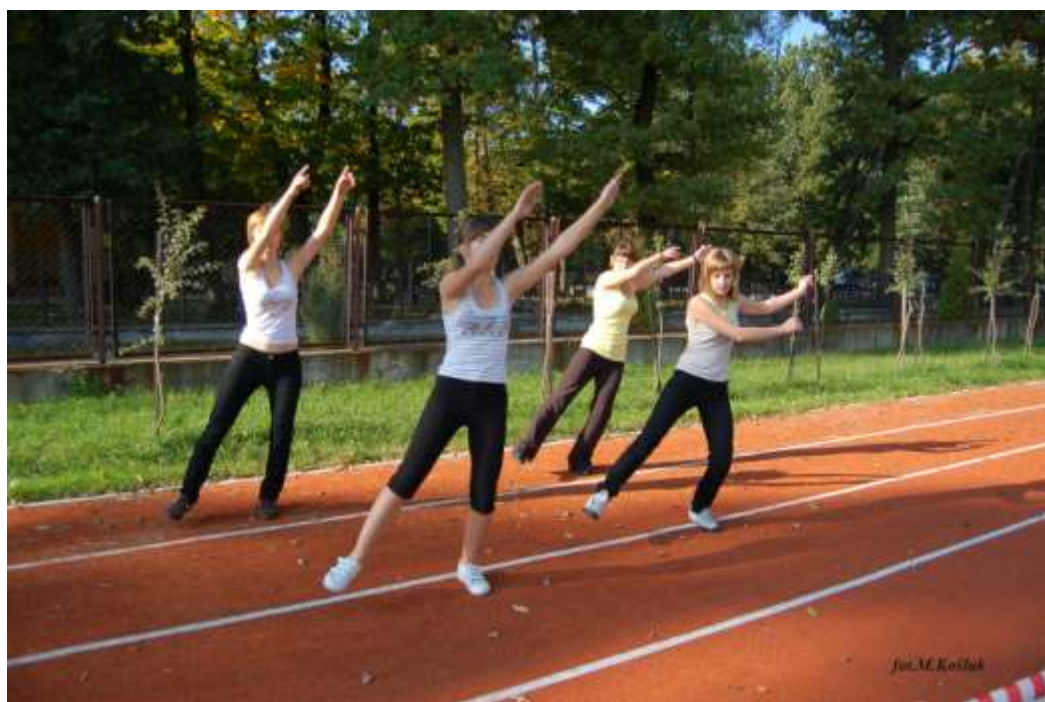
występ grupy tanecznej