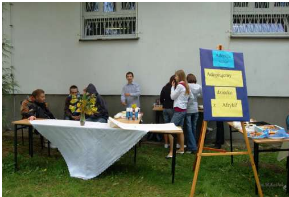
dochody tego bufetu przeznaczone na „Adopcję serca”

innych atrakcji. Zorganizowano w tym dniu na terenie szkoły zbiórkę makulatury, puszek aluminiowych, zużytych baterii. Odbyły się także konkursy wiedzy z zakresu ekologii, gry i zabawy, pokaz mody z odpadów i surowców wtórnych.