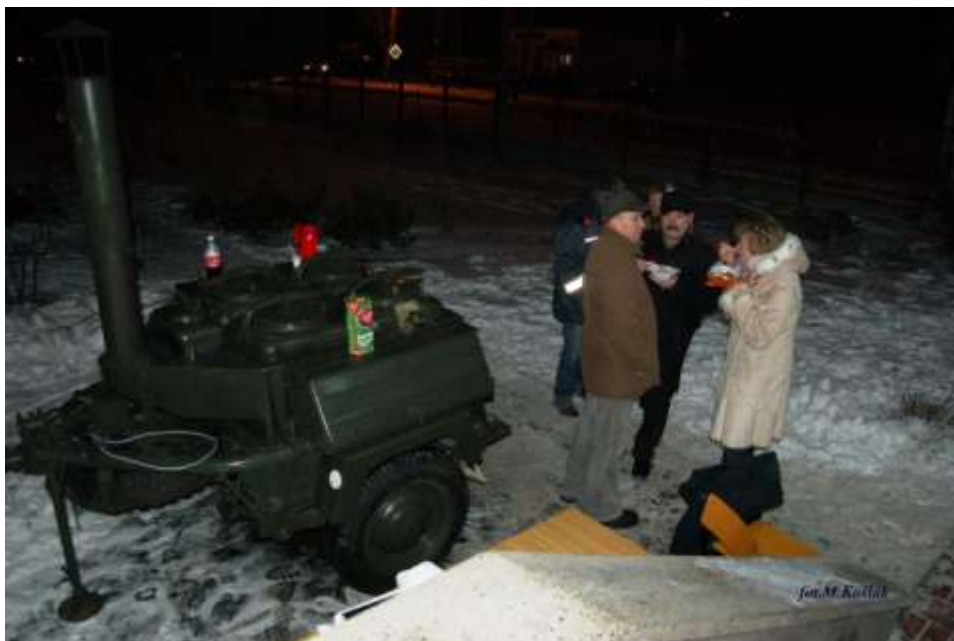
Wszyscy darczyńcy mogli się pokrzepić smaczną wojskową grochówką