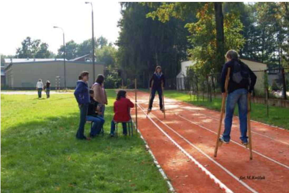
zawody w biegach na szczudłach