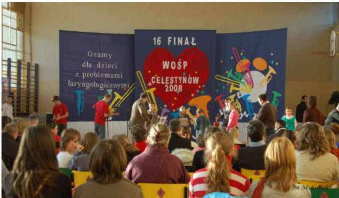
Występ młodzieżowego zespołu muzycznego

Dużym zainteresowaniem cieszyła się sprzedaż wyrobów wykonanych przez uczniów i opiekuna „Koła Koralińców”. Ponadto chlebem ze smalczykiem i ogórkiem oraz wojskową grochówką można było uzupełnić zapasy energii przed wieczorną dyskoteką.